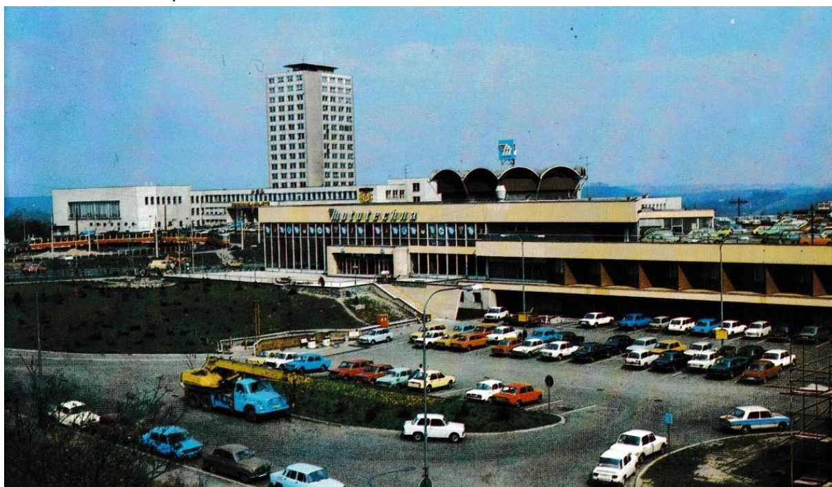
Moderní autosalon a servis Mototechny v Praze na Jarově, sedmdesátá léta 20. století. (30 let n. p. Mototechna)

Specializovaná mapa dokumentující síť servisů v období 1949 až 1989 přináší informaci o rovnoměrném rozložení servisních podniků po celém území bývalého Československa. Jde o doklad plánovitého uspořádání základní servisní sítě, která byla v oněch dobách zajišťována především národním podnikem ČSAO (Československé automobilové opravy). Jednotlivá servisní střediska byla často specializována na konkrétní značku automobilu. Tuto pátevní síť dále doplňovaly další opravárenské podniky jako například servisy výrobních družstev. V řadě případů lze ve specializované mapě opět dohledat body shodné s umístěním servisů z období před rokem 1948 – tedy vyvlastněné soukromé podniky dále provozované v rámci socialistického hospodářství.