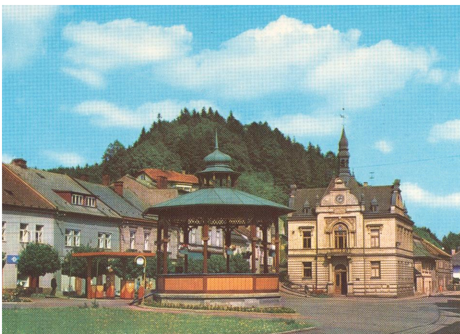
Čerpací stanice na Komenského náměstí v Brandýse nad Orlicí v sedmdesátých letech 20. století. Altán v popředí zde můžeme vidět i dnes, benzínka už ve městě není.

Tato mapa je společným výstupem FHS UK a NTM a je také součástí souboru map: „Specializovaná mapa s odborným obsahem – Mapa vývoje silniční sítě a rozvoje motorismu“.