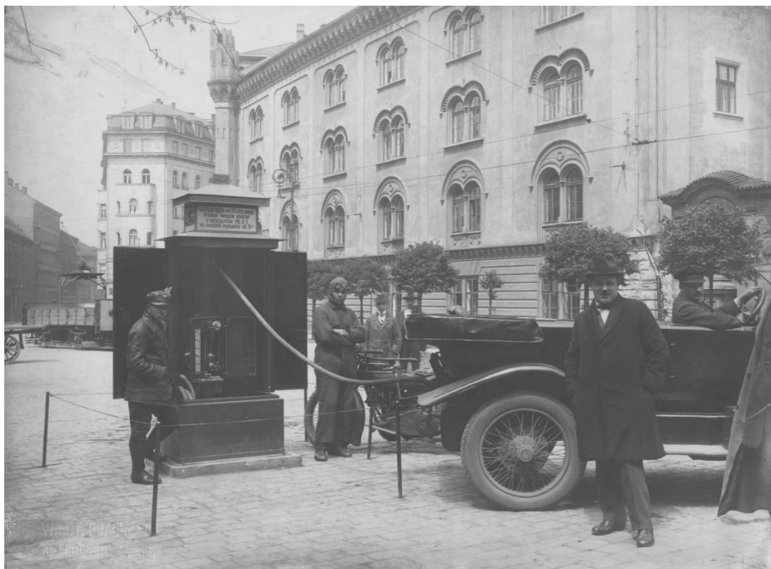
První čerpací stanice u nás otevřela firma Bratři Zikmundové v Praze na dnešním náměstí Republiky v roce 1923.

Tato mapa je společným výstupem FHS UK a NTM a je také součástí souboru map: „Specializovaná mapa s odborným obsahem – Mapa vývoje silniční sítě a rozvoje motorismu“.